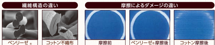
皮膚の弾性に類似した疑似皮膚を異なる不織布(ベンリーゼ®, コットン®)で擦った場合に表面上に生じる傷。

他の繊維よりなめらかで真円に近いため、摩擦が小さく、擦れ合った時のダメージが抑えられます。そのため、産後のデリケートな肌にもおすすめです。